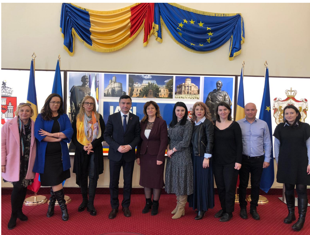
Réunion avec la mairie