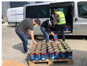
Merci également à tous ceux qui nous envoient des messages de soutien et des petits colis !

La SC Sophia nous a également fait don de 15 kg de tissu et de patrons de masques, qui nous ont permis de réaliser nos propres masques.