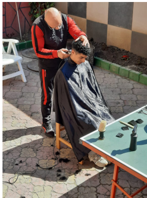
sympathique qui casse la routine. A quand la manucure ?