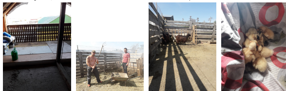
Des nouvelles du Belvédère