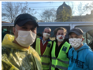
Un petit point sur notre situation...